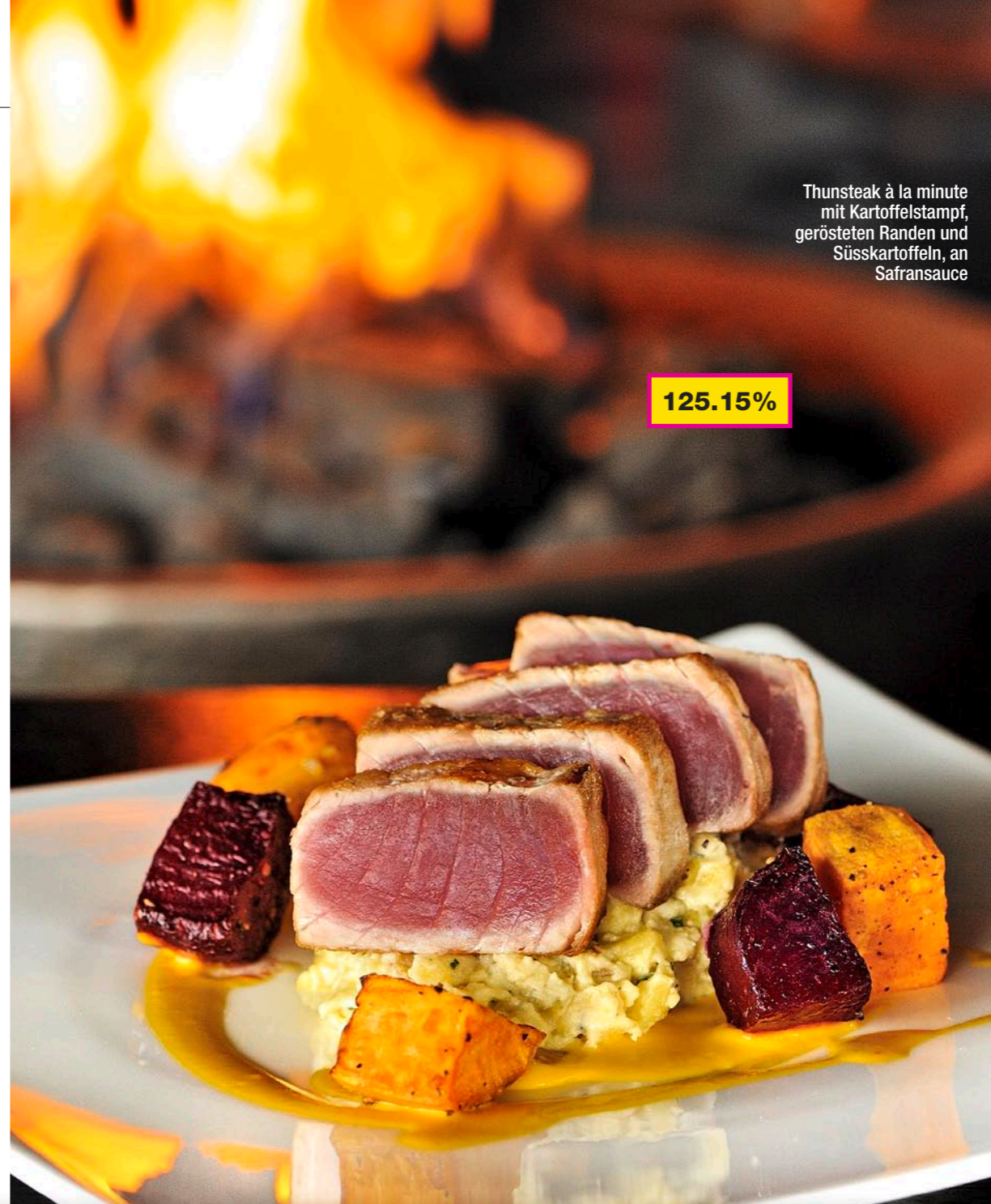
Thunsteak à la minute mit Kartoffelstampf, gerösteten Randen und Süsskartoffeln, an Safransauce