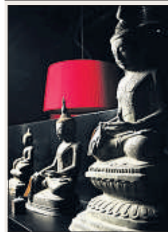
Fusion-Küche und Asia-Flair.