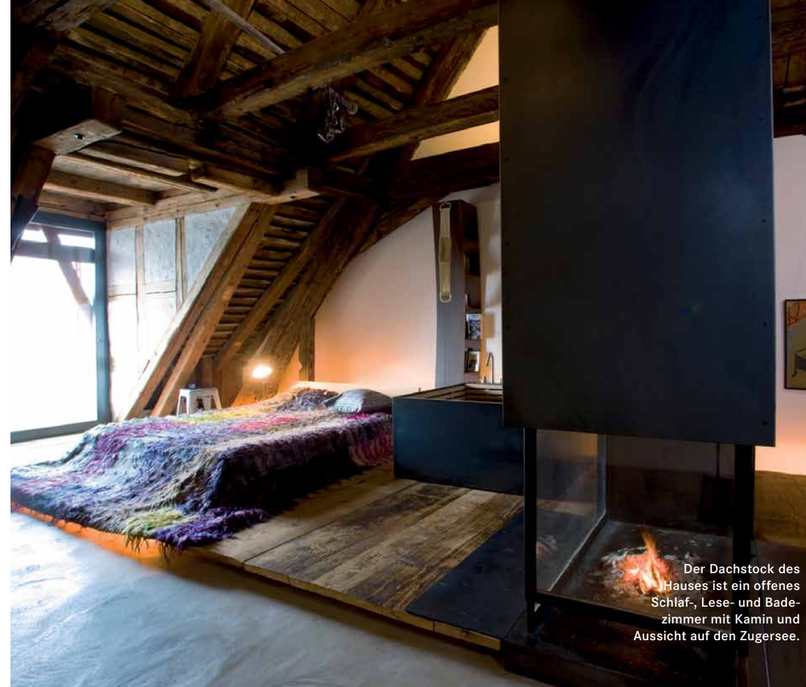
Der Dachstock des Hauses ist ein offenes Schlaf-, Lese- und Badezimmer mit Kamin und Aussicht auf den Zugersee.