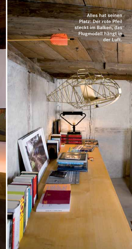
Alles hat seinen Platz: Der rote Pfeil steckt im Balken, das Flugmodell hängt in der Luft.